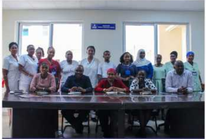
Muuguzi Mkuu wa Serikali ametoa wito kwa wakunga na wauguzi kufata taratibu na maadili ya uuguzi na ukunga ili kutoa huduma iliyo bora kwa wagonjwa. Picha ya kikao cha uuguzi na ukunga katika Hospitali ya Rufaa ya Kumbukumbu ya Mwalimu J.K Nyerere.

Ameyasema hayo akiwa kwenye kikao pamoja na wauguzi na wakunga katika Hospitali ya Rufaa ya Kumbukumbu ya Mwalimu J.K Nyerere siku ya 16/08/2023 alipokuwa akifanya ziara ili kukagua huduma za uuguzi na ukunga zinavyofanyika katika Hospitali ya Rufaa ya Kumbukumbu ya Mwalimu J.K Nyerere.